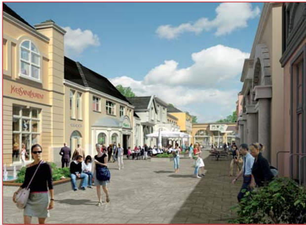
Abb.: Ladenpassage Eifel-Ahr-Portal

Dies wird durch den besonderen Focus auf der Vermarktung regionaler Produkte sowie die touristische Einbindung in die Region angestrebt. Auch die Qualität der Architektur und der Premium-Marken soll besonderen Anforderungen gerecht werden.