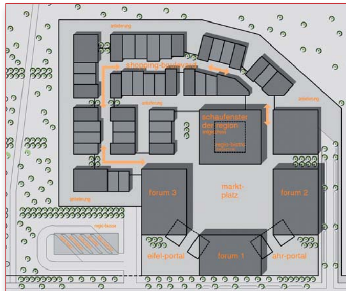
Abb.: Übersichtsplan Eifel-Ahr-Portal

Die Eifel-Ahr-Region bietet eine vielseitige Palette an touristischen Angeboten. Dabei handelt es sich um überwiegend naturbezogenen, „sanften“ Tourismus. Die gute Erschließung zu den nahen Ballungsräumen über die Bundesautobahnen (A61, A565, A1) mit rund 20 Millionen Einwohnern in einer guten Autostunde wirkt sich vorteilhaft aus. Um die touristischen Angebote auch gerade bei schlechtem Wetter zu ergänzen, welches auch in der Eifel-Ahr-Region ab und zu vorkommen soll, sind drei Hallen für Museen/Foren vorgesehen. Die Foren stehen auch als Aktionsflächen für besondere Highlights der Region bereit.