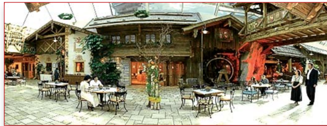
Abb.: Marktplatz im Trofana Tirol

Das große Angebot unter einem Dach, das zudem noch attraktiv präsentiert wird, soll hier einen neuen Impuls erzeugen. Wünschenswert wäre die Gestaltung der Markthalle und ihrer Verkaufsstände in Anlehnung an die baulichen Charakteristika der Region.