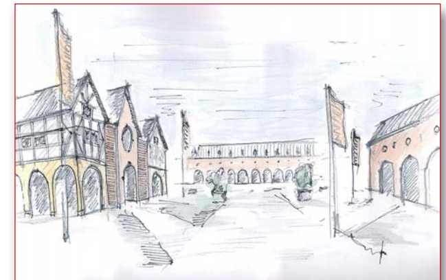
Abb.: Marktplatz Eifel-Ahr-Portal